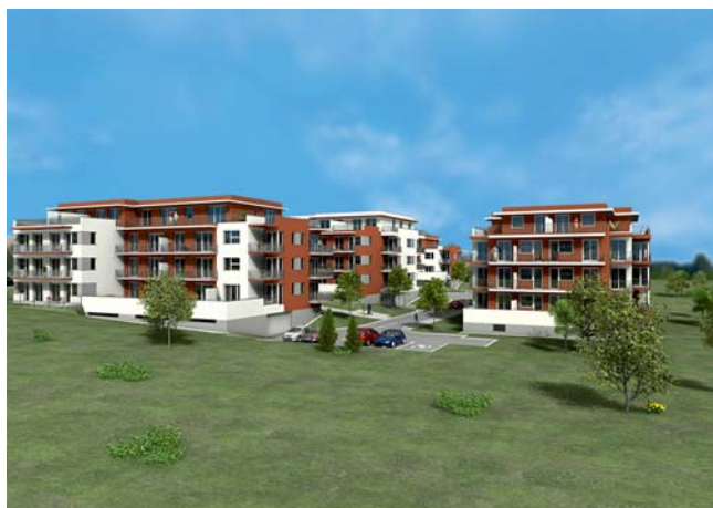
vizualizace projektu Pod Hvězdárnou

CENTRAL GROUP a.s. daroval 1 mil korun MČ Praha - Ďáblice. Nevíme, zda-li si kupuje čisté svědomí za hyzdění Ďáblic plánovanou výstavbou 4 viladomů v projektu Pod Hvězdárnou nebo to měl být jakýsi úplatek? Zastupitelstvo na svém jednání v r. 2007 většinou hlasujících odmítlo tento projekt. O to větší překvapení připravila opět rada MČ všem, když v rozporu s usnesením ZMČ dne 2.10.2007 na svém 20. zasedání prohlašuje, že „...starostka a RMČ Praha Ďáblice respektuje a souhlasí s umístěním stavby, která bude zredukována o jedno podlaží.“ Co k tomu dodat?